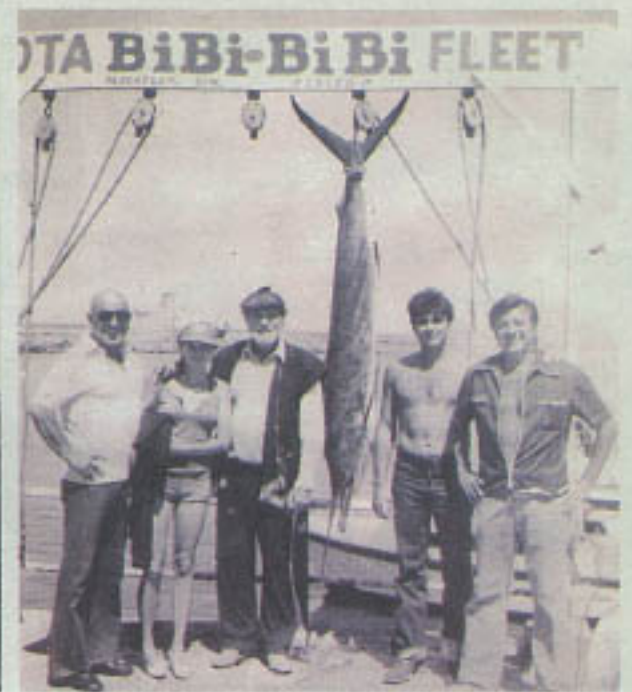
Telly Savalas "Kojak", Burt Lancaster y Arturo de Cima al final de un día de pesca en mayo de 1979.